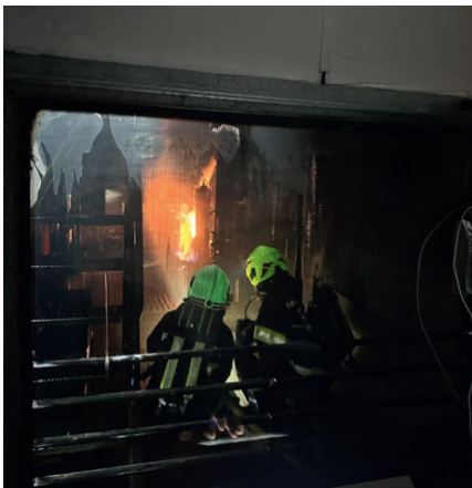
Übung im Brand Container