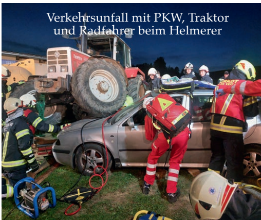
Verkehrsunfall mit PKW, Traktor und Radfahrer beim Helmerer