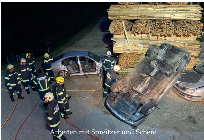
Arbeiten mit Spreitzer und Schere