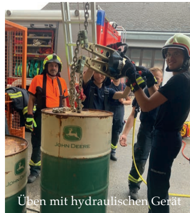
Üben mit hydraulischen Gerät