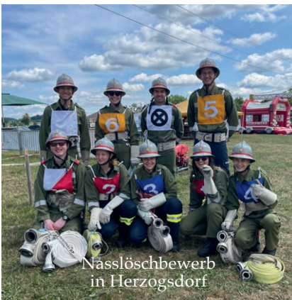
Nasslöschbewerb in Herzogsdorf