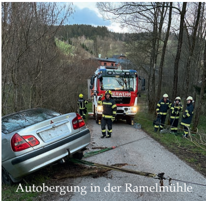
Autobergung in der Ramelmühle