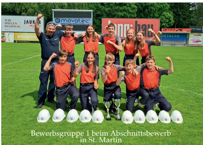
Bewerbsgruppe 1 beim Abschnittsbewerb in St. Martin

In die heurige Bewerbsaison starteten wir mit beiden Gruppen in der Wertungsklasse 1. Mit einem klaren Ziel, der Aufstieg mit der Gruppe 1 in die Bezirksliga. Nach einem brillanten Start mit Podestplätzen, schlichen sich leider am Ende der Saison zu viele Fehler ein, wo sich leider der Aufstieg knapp nicht ausging. Auch wenn dies nicht gelang, ist der Ansporn für das nächste umso größer den Aufstieg zu schaffen.