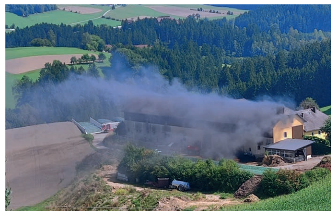
BRAND FAMILIE RECHBERGER