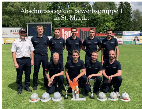
Abschnittssieg der Bewerbungsgruppe 1 in St. Martin