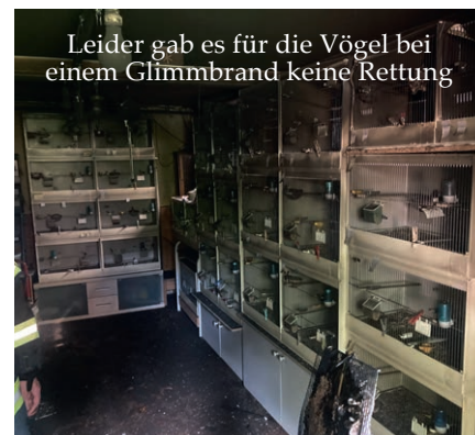
Leider gab es für die Vögel bei einem Glimmbrand keine Rettung