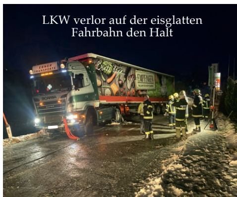
LKW verlor auf der eisglatten Fahrbahn den Halt