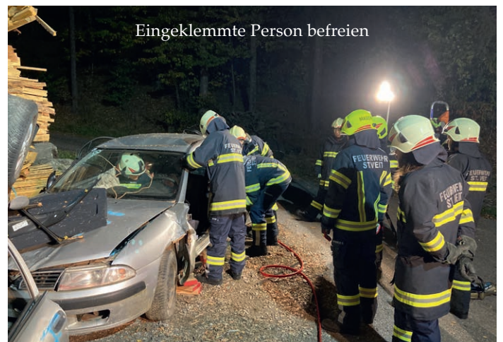
Eingeklemmte Person befreien