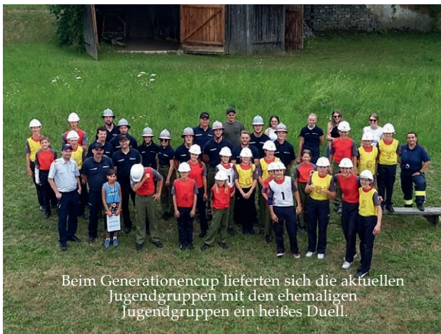
Beim Generationencup lieferten sich die aktuellen Jugendgruppen mit den ehemaligen Jugendgruppen ein heißes Duell.

Ein gelungener Abschluss der Wettbewerbssaison. Der Landesbewerb fand heuer in Aspach-Wildenau im Bezirk Braunau statt. Mit einem 2. Rang in Bronze der Gruppe 1 konnten wir auf Landesebene wieder einmal aufhorchen lassen.