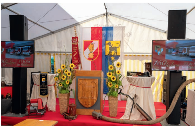
150 JAHRE FF ST.VEIT IM MÜHLKREIS