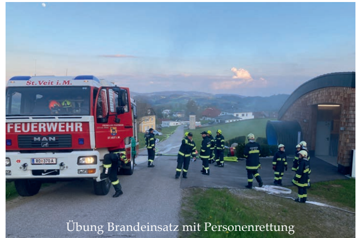
Übung Brandeinsatz mit Personenrettung