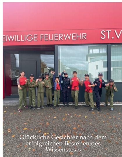
Glückliche Gesichter nach dem erfolgreichen Bestehen des Wissenstests