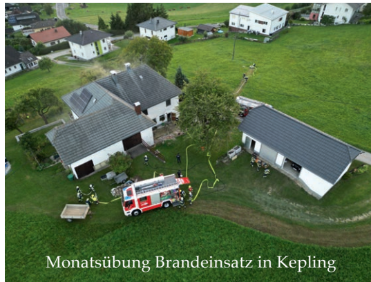
Monatsübung Brandeinsatz in Kepling