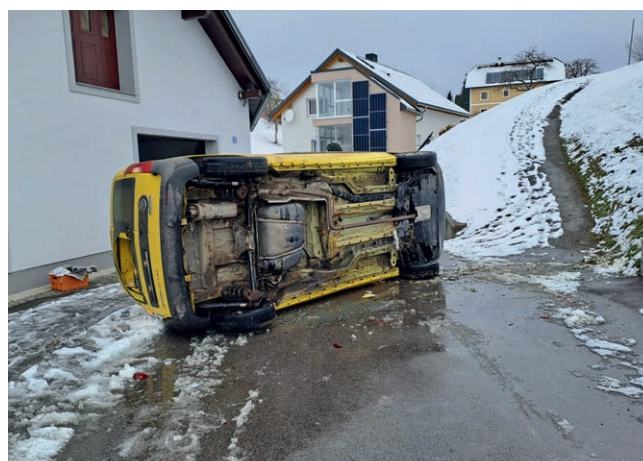
Glück im Unglück, ein Auto des Postzustellers machte sich selbstständig und stürzte über den Posthügel ab, wo es dann vor einem Haus zum Liegen kam