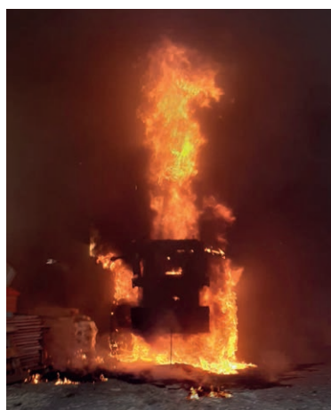
Durch schnelles Eingreifen konnte ein Vollbrand beim landwirtschaftlichen Anwesen der Familie Rechberger verhindert werden