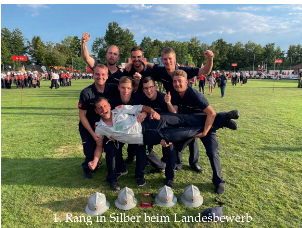
1. Rang in Silber beim Landesbewerb