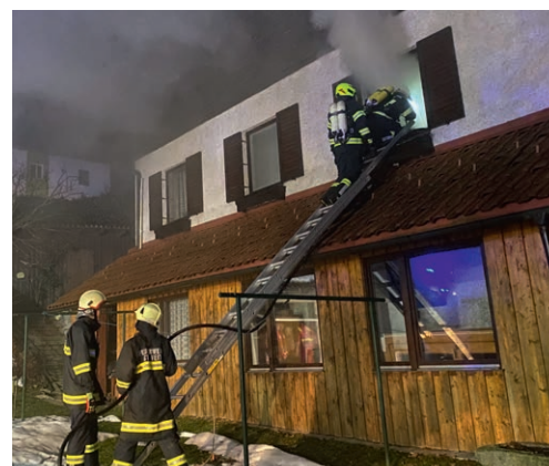
Wohnhausbrand in Kepling