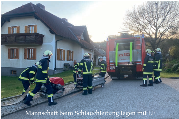
Mannschaft beim Schlauchleitung legen mit LF