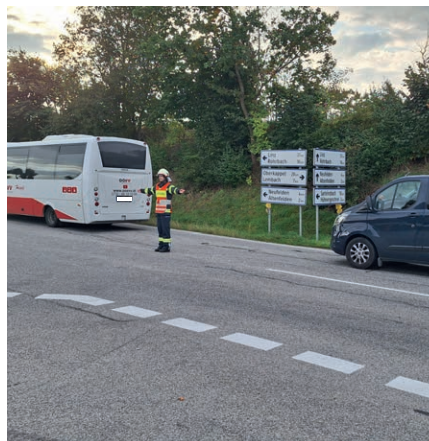
Lummerstorfer Eva beim Regeln des Verkehrs in Kleinzell