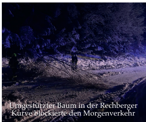
Umgestürzter Baum in der Rechberger Kurve blockierte den Morgenverkehr

Für eine Feuerwehr ist jeder Einsatz eine neue Herausforderung, die es zu meistern gilt. Jeder Alarm ruft die Männer und Frauen der Feuerwehr dazu auf, sich den unterschiedlichsten Situationen zu stellen. Sei es ein brennendes Gebäude, ein Verkehrsunfall oder ein technischer Einsatz, bei dem sich Menschen und Tiere in Gefahr befinden. Die Feuerwehr ist stets darauf vorbereitet, Leben zu schützen und Gefahren zu bannen. Für diesen Moment üben wir, um mit den uns zur Verfügung stehenden Geräte und Einsatzmittel, die einzelnen Aufgaben bestmöglich meistern zu können.