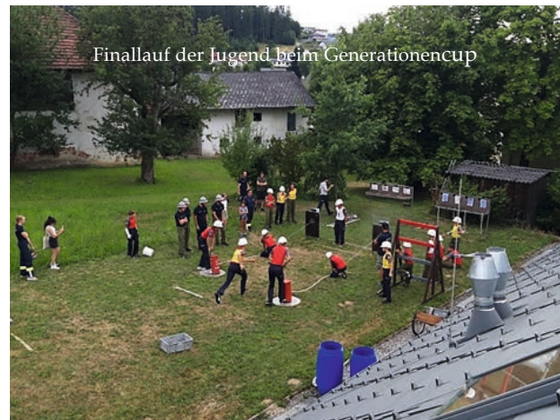
Finallauf der Jugend beim Generationencup