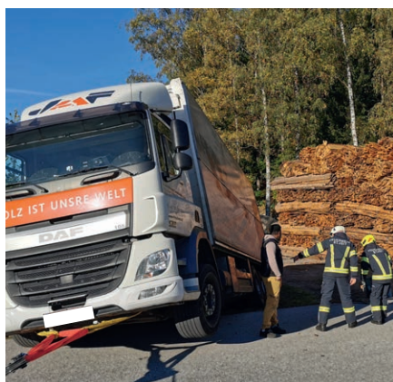
Durch ein missglücktes Umkehrmanöver drohte ein Lkw in einen Fischteich nahe Zulehner-Kurve abzustürzen