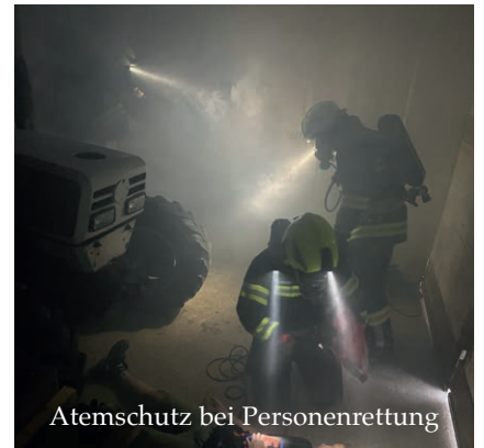
Atemschutz bei Personenrettung