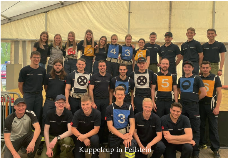
Kuppelcup in Peilstein

Nach einem turbulenten Jahr mit Landesbewerb in St. Peter und Bundesbewerb in St. Pölten, starteten drei Bewerbungsgruppen in die Bewerbssaison 2023, unter anderem die erste Damenbewerbungsgruppe in der Geschichte der Feuerwehr St. Veit. Nach einer langen Vorbereitung, die bereits im Winter begann, gelang uns ein erfolgreicher Start beim Kuppelcup in Peilstein, wo wir mit vier Gruppen teilnahmen. Auch bei weiteren zahlreichen Bewerben auf Abschnitts- und Bezirksebene konnten wir spitzen Leistungen erbringen. Besonders in Erinnerung blieb uns der Landesbewerb in Aspach (Bezirk Braunau), wo wir die erfolgreiche Bewerbssaison abschlossen und gemeinsam gebührend feierten.