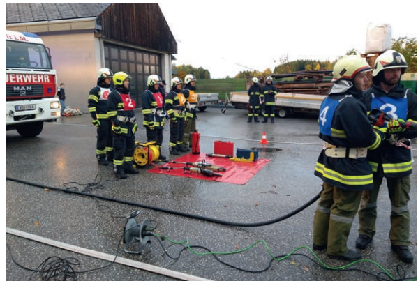
Abnahme Technische Hilfeleistung in Gold