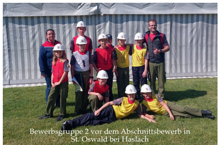
Bewerbsgruppe 2 vor dem Abschnittsbewerb in St. Oswald bei Haslach

Für die Gruppe 2 ging es heuer vorrangig um das Kennenlernen des Bewerbswesens und das Erreichen des Leistungsabzeichens. Da der Großteil der Gruppe neu bei der FF-Jugend einstieg, war es uns klar, dass es schwer wird die Klasse 1 zu halten. Der Abstieg war nicht zu vermeiden aber wir konnten viel lernen. Nächstes Jahr geht es in der Klasse 2 weiter. Nichts desto Trotz sind wir top motiviert, es nächstes Jahr besser zu machen!