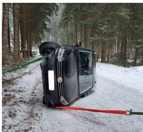
Auf der glatten Fahrbahn kam nahe „Schauberg“ ein Auto von der Straße ab und kollidierte mit einem Baum