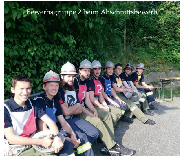
Bewerbungsgruppe 2 beim Abschnittsbewerb