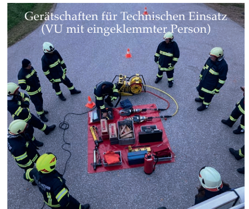
Gerätschaften für Technischen Einsatz (VU mit eingeklemmter Person)